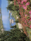
Option : soirée folklorique ou chants basques

J3 Espélette / St Jean de Luz Départ pour Espélette, découverte à pied de son bourg, avec ses façades décorées de cordes de piments. Plus : découverte de ce dernier mondialisme connu pour ses poses délicates et son grand parfum. En profonds en intégrés, le menant d'Espélette fait partie du patrimoine de la région. Puis, jusqu'à Déjeuner à l'hôtel. Départ pour Saint Jean de Luz, ville de la destination France au mariage de Louis XIV et d'Anne Marie. Thèmes : photosques, le port, la place, seoul : l'hôtel, et l'église St Jean Baptiste. Retour à l'hôtel.