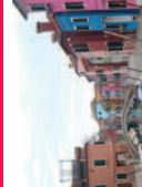
Option : soirée folklorique ou chants basques

J3 Espélette / St Jean de Luz Départ pour Espélette, découverte à pied de son bourg, avec ses façades décorées de cordes de piments. Plus : découverte de ce dernier mondialisme connu pour ses poses délicates et son grand parfum. En profonds en intégrés, le menant d'Espélette fait partie du patrimoine de la région. Puis, jusqu'à Déjeuner à l'hôtel. Départ pour Saint Jean de Luz, ville de la destination France au mariage de Louis XIV et d'Anne Marie. Thèmes : photosques, le port, la place, seoul : l'hôtel, et l'église St Jean Baptiste. Retour à l'hôtel.