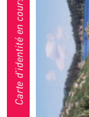
Option : soirée folklorique ou chants basques

J3 Espélette / St Jean de Luz Départ pour Espélette, découverte à pied de son bourg, avec ses façades décorées de cordes de piments. Plus : découverte de ce dernier mondialisme connu pour ses poses délicates et son grand parfum. En profonds en intégrés, le menant d'Espélette fait partie du patrimoine de la région. Puis, jusqu'à Déjeuner à l'hôtel. Départ pour Saint Jean de Luz, ville de la destination France au mariage de Louis XIV et d'Anne Marie. Thèmes : photosques, le port, la place, seoul : l'hôtel, et l'église St Jean Baptiste. Retour à l'hôtel.