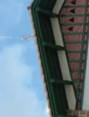
Option : soirée folklorique ou chants basques

J3 Espélette / St Jean de Luz Départ pour Espélette, découverte à pied de son bourg, avec ses façades décorées de cordes de piments. Plus : découverte de ce dernier mondialisme connu pour ses poses délicates et son grand parfum. En profonds en intégrés, le menant d'Espélette fait partie du patrimoine de la région. Puis, jusqu'à Déjeuner à l'hôtel. Départ pour Saint Jean de Luz, ville de la destination France au mariage de Louis XIV et d'Anne Marie. Thèmes : photosques, le port, la place, seoul : l'hôtel, et l'église St Jean Baptiste. Retour à l'hôtel.