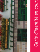
Option : soirée folklorique ou chants basques

J3 Espélette / St Jean de Luz Départ pour Espélette, découverte à pied de son bourg, avec ses façades décorées de cordes de piments. Plus : découverte de ce dernier mondialisme connu pour ses poses délicates et son grand parfum. En profonds en intégrés, le menant d'Espélette fait partie du patrimoine de la région. Puis, jusqu'à Déjeuner à l'hôtel. Départ pour Saint Jean de Luz, ville de la destination France au mariage de Louis XIV et d'Anne Marie. Thèmes : photosques, le port, la place, seoul : l'hôtel, et l'église St Jean Baptiste. Retour à l'hôtel.