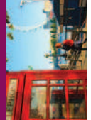
Carte d'identité en cours de validité obligatoire

J4 Région Arrivée dans votre région tôt le matin.